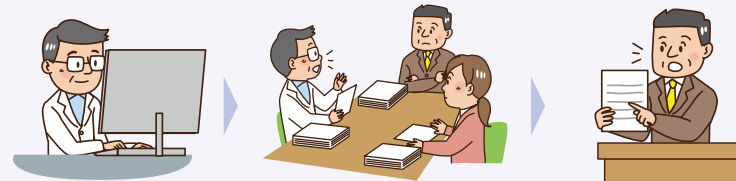
①事前に決定した手順に従い、論文を選別

研究レビューを行う人は、研究論文が登録されているデータベースを用いて、論文を抽出します。抽出に当たっては、検索に用いるキーワードなどあらかじめ条件を設定します。抽出された論文を絞り込み、最終製品又は機能性関与成分に「機能性がある」と認められているのか、もしくは認められていないのかを分類します。事業者の都合で機能性があることを示す論文だけを意図的に抽出することはできません。